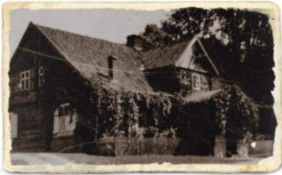
Bilder unten: Neumühle etwa im Jahre 1938